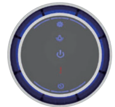
視認性と使いやすさを備えた操作部